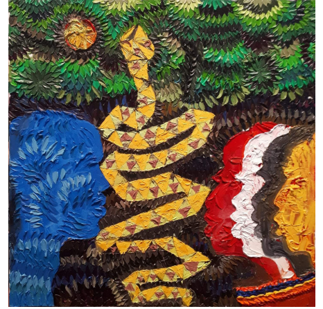
QUADRI PECHE HUILE A LA SPATULE SUR TOILE 80 X 80