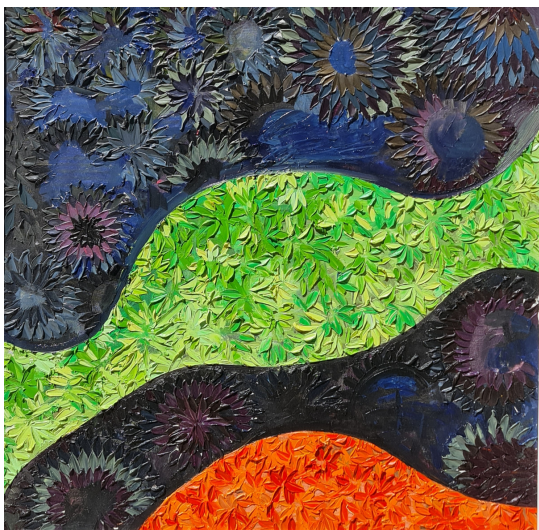
ORIGINE DU MONDE 1 HUILE A LA SPATULE SUR TOILE 80 X 80