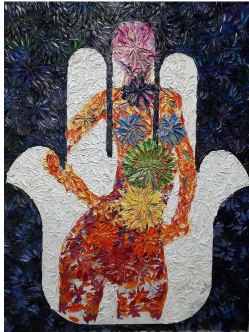
SLENVOL4 HUILE A LA SPATULE SUR TOILE 90 X 120 CM