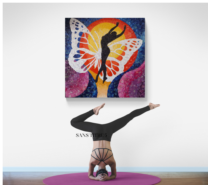
L'ENVOL I HUILE SUR TOILE AU COUTEAU 150 X 150