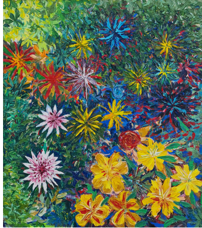
SECRET GARDEN 2 HUILE A LA SPATULE SUR TOILE 70 X 80 8.000 DH