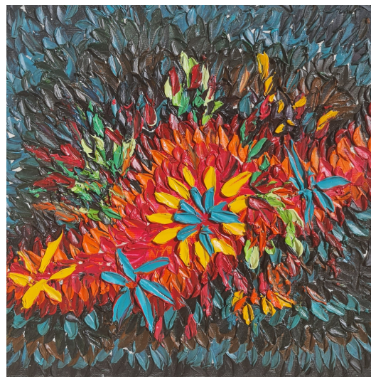
ORIGINE DU MONDE 2 HUILE A LA SPATULE SUR TOILE 40 X 40