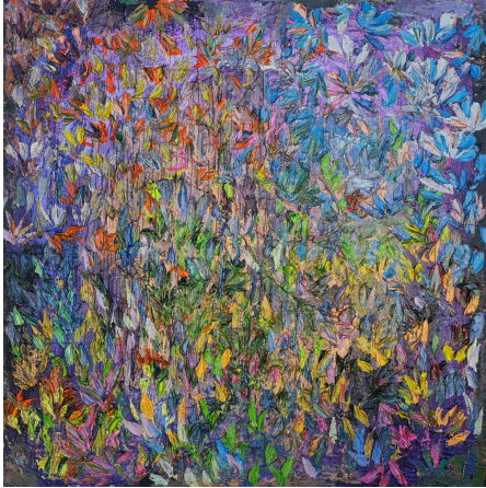
SECRET GARDEN 1 HUILE A LA SPATULE SUR TOILE 80 X 80