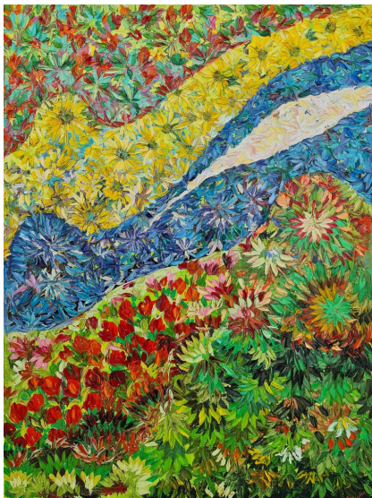
L'ENVOL.2 HUILE A LA SPATULE SUR TOILE 90X 120 17.000 DH